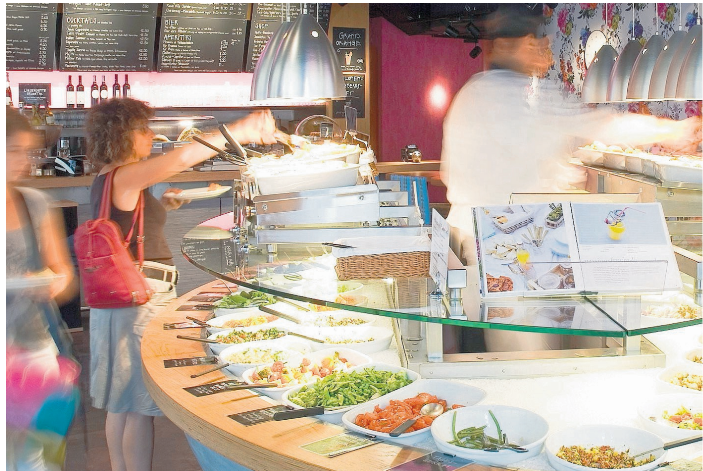
In Winterthur befindet sich seit 2002 das von St. Gallen aus nächstgelegene «Tibits». Das Lokal bietet ausschliesslich vegetarische Speisen an.